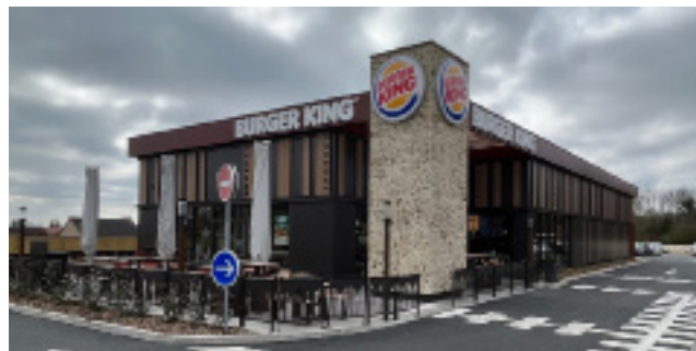
Site de Chelles