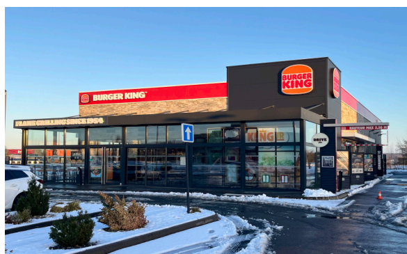
Site de Bruay-la-Buissière

BK OPCI vise à proposer la performance d'un patrimoine investi principalement dans des immeubles commerciaux à usage de restauration rapide sous l'enseigne Burger King en France métropolitaine.